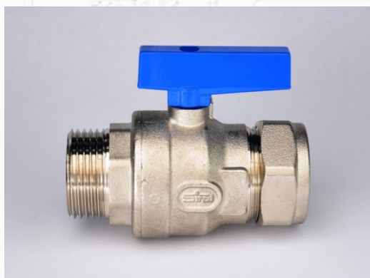
Maniglia blu: attacchi dado bicono/filettatura maschio ISO228 battuta piana

Il corpo è in ottone CW617N stampato a caldo e con superficie nichelata: offre elevata resistenza e tenuta nel tempo.