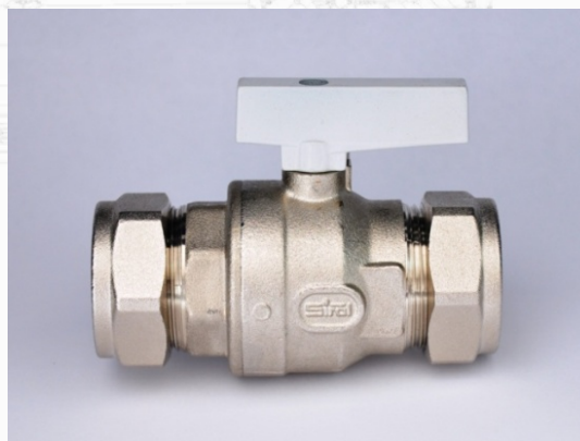
Maniglia grigia: attacchi con dado bicono su entrambe i lati.

Destinate all'uso con acqua calda e fredda, queste valvole trovano impiego ideale nella connessione di caldaie murali, perché gli attacchi con dado e bicono permettono la connessione dei tubi in rame utilizzati generalmente per gli allacciamenti delle caldaie, impianti di riscaldamento e acs.